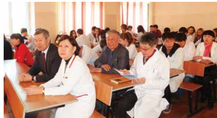
Во время студенческой конференции БГУ, 2012 г.