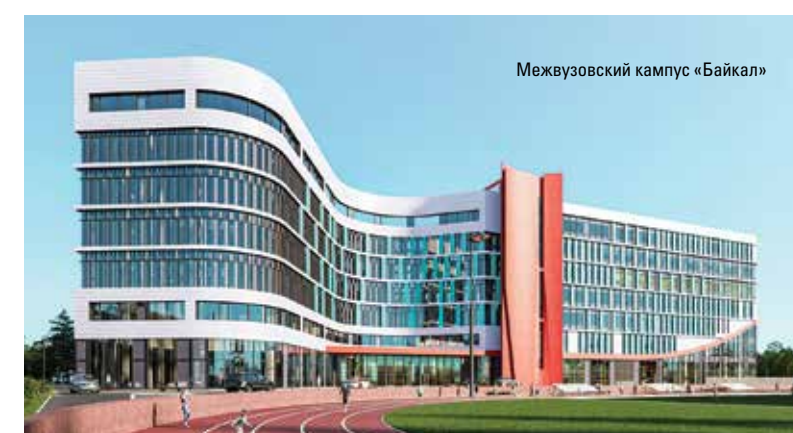
Межвузовский кампус «Байкал»