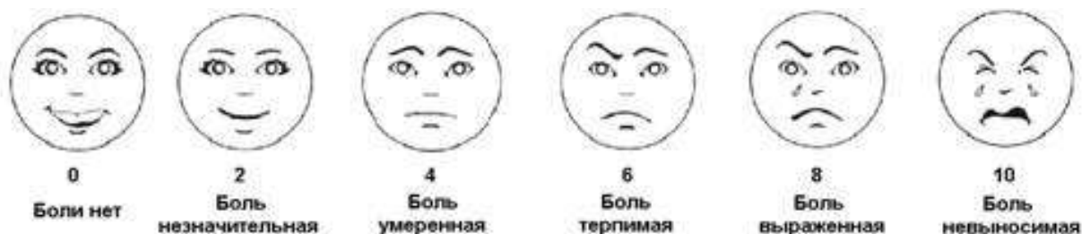
Рис.2 Шкала гримас Вонг-Бейкера предназначена для оценки состояния взрослых подопечных и детей старше 3 лет.

Шкала гримас состоит из 6 лиц, начиная от смеющегося (нет боли) до плачущего (боль невыносимая).